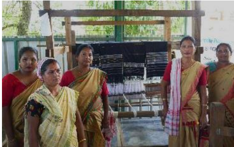
Stolz präsentieren die Frauen ihre selbst produzierten Stoffe. (2023)

Fast die Hälfte der Frauen, die die Trainings besucht und Unterstützung bei der Gründung erhalten haben, konnten ihr Einkommen bereits deutlich steigern und somit einen Schritt zur Existenzsicherung schaffen.