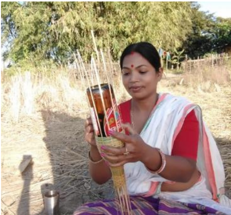
In den Trainings lernen Frauen die Verarbeitung von Bambus und Rattan. (2023)

100 Frauen haben Business-Pläne entwickelt, um damit Zugang zu Bankkrediten zu erhalten.