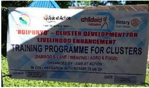
Die Fortbildungen vermitteln handwerkliche Fähigkeiten und unternehmerisches Denken. (2023)