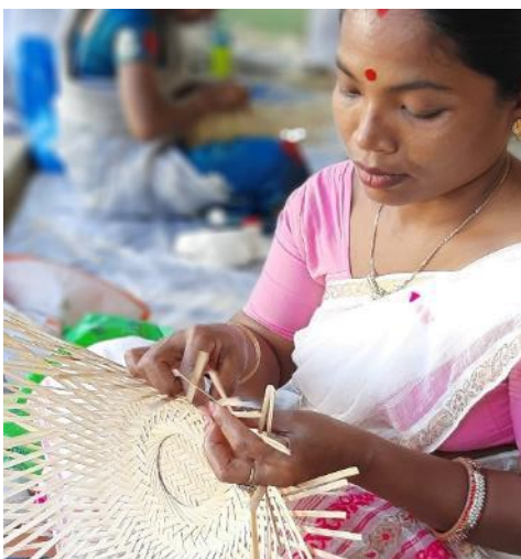
Daraus stellen sie traditionelle Gegenstände her, die sie verkaufen können. (2023)