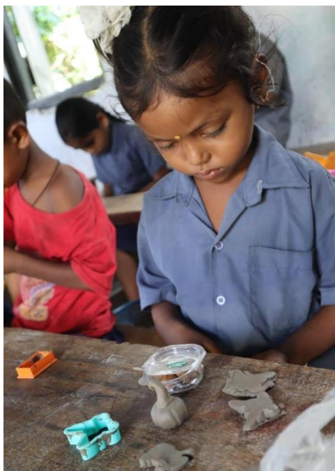
Bildung muss kindgerecht gestaltet sein, um Wissen effektiv zu vermitteln. (2024)