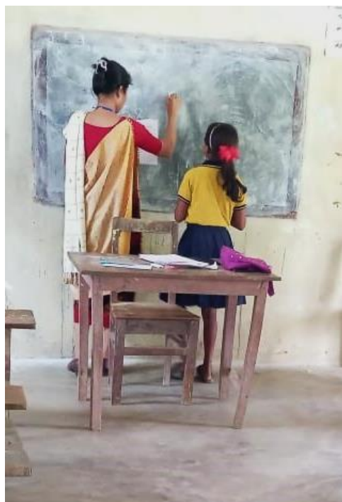
Der Zugang zu guter Bildung in Karbi Anglong ist erschwert und nur wenige Kinder schaffen einen Schulabschluss. (2024)