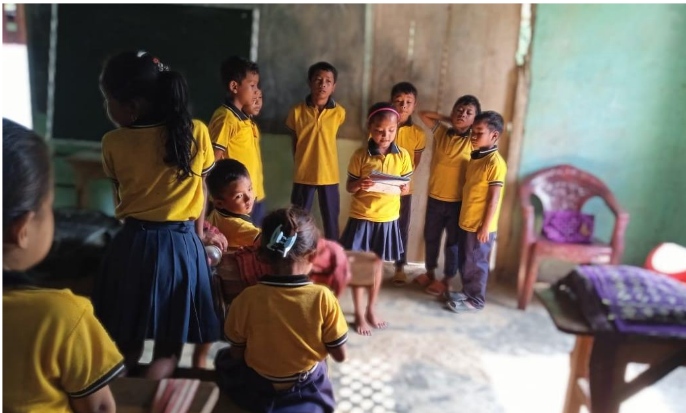
Wir fördern Kinder ganzheitlich von klein auf durch hochwertige Bildungsangebote. (Karbi Anglong, Assam, 2024)

(Karbi Anglong, Indien, Projektfortschrittsbericht, Juli 2024)