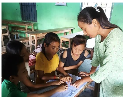
Nachhilfe für lernschwache Schüler soll vor dem Schulabbruch schützen. (2024)