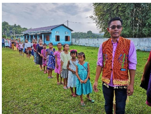
Ein wichtiger Teil des Projekts ist die Ausbildung von Lehrkräften in interaktiven Lehrmethoden. (2024)