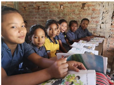
Ein guter Abschluss eröffnet diesen Schülerinnen viel mehr Möglichkeiten. (2024)