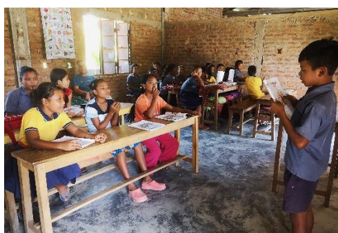
In Kinderclubs lernen Kinder spielerisch ihre Rechte kennen. (2024)